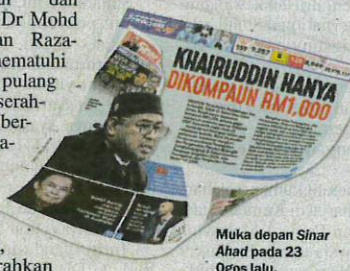
Muka depan Sinar Ahad pada 23 Ogos lalu.

Kata beliau, langkah tersebut adalah tanda memohon maaf dan sebagai bertanggungjawab atas kesilapannya melanggar prosedur operasi standard (SOP) kuarantin wajib bulan lalu, yang menyebabkan beliau dikompauan RM1,000.