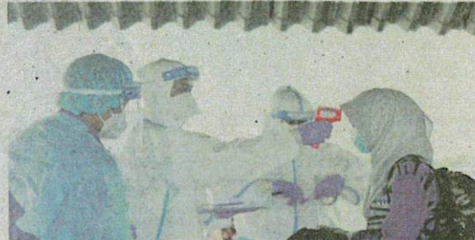
KKM mengesan satu kes melalui saringan di tempat kerja, manakala satu kes lagi adalah saringan sebelum bersalin di Sarawak.

"Sehingga kini, sejumlah lapan kes positif sedang dirawat di Unit Rawatan Rapi (ICU), dengan lima kes memerlukan