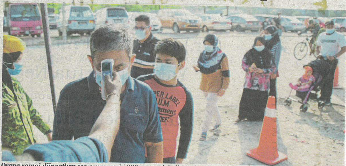
Orang ramai diingatkan terus mematuhi SOP yang telah ditetapkan kerajaan bagi mengekang COVID-19.

“Jumlah kumulatif kes sudah pulih sepenuhnya daripada COVID-19 adalah 8,965 kes atau 96.7